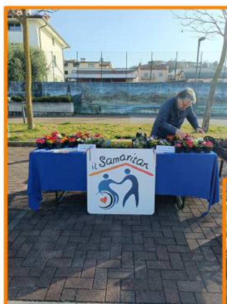
Mercatini a Ragogna, 6 marzo 2026