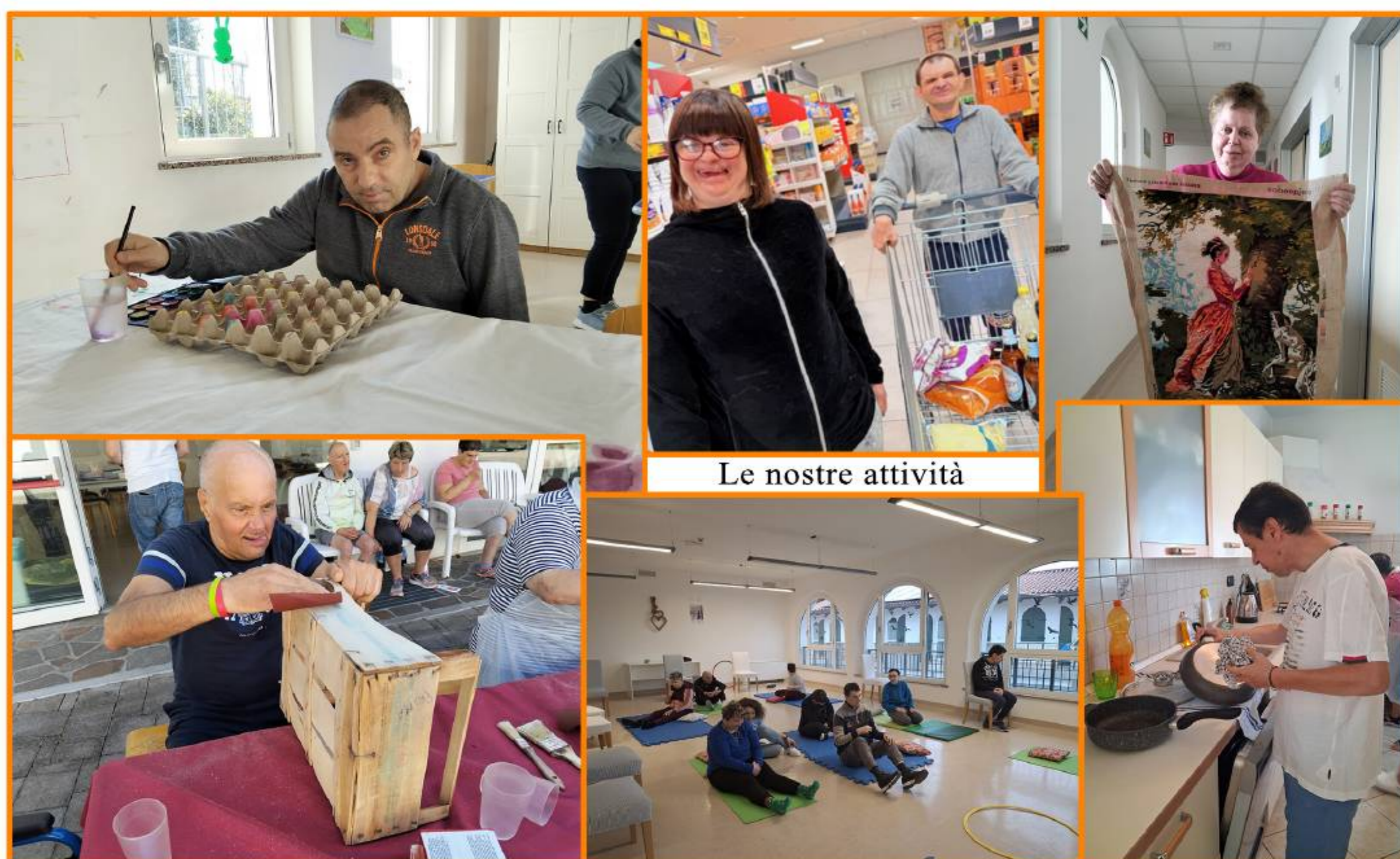
Le nostre attività

La base di ogni progetto è la capacità di coltivare il desiderio per ambire alla volontà. Non importa se non si raggiungerà mai la totale autonomia, ciò che conta, e che fa stare meglio, è lo sviluppo delle proprie, individuali potenzialità. Grazie al quotidiano lavoro delle persone che operano al Samaritan (volontari e operatori dai diversi profili professionali), questa tendenza si sente nell'aria, si percepisce guardando alle molteplici attività che vengono svolte, artistiche e laboratoriali; all'attenzione agli aspetti sociali, sanitari ed economici; alle costanti preoccupazioni degli operatori; alla passione che ci mette il direttivo dell'associazione; alla puntuale collaborazione della cooperativa Fai per una organizzazione che sia efficace senza sacrificare il benessere dei dipendenti. Un doveroso ringraziamento va ai benefattori, che silenziosamente concorrono ad un ideale di benessere comunitario. Voglio inoltre esprimere tutto il mio riconoscimento all'operatività del personale afferente alle strutture pubbliche che rendono possibile una integrata e proficua collaborazione. Infine, un auspicio: che la politica rifletta sulla necessità di maggiori risorse economiche per la piena realizzazione dei progetti di QdV che verranno, evitando il rischio che restino soltanto un bell'ideale a forma di legge.