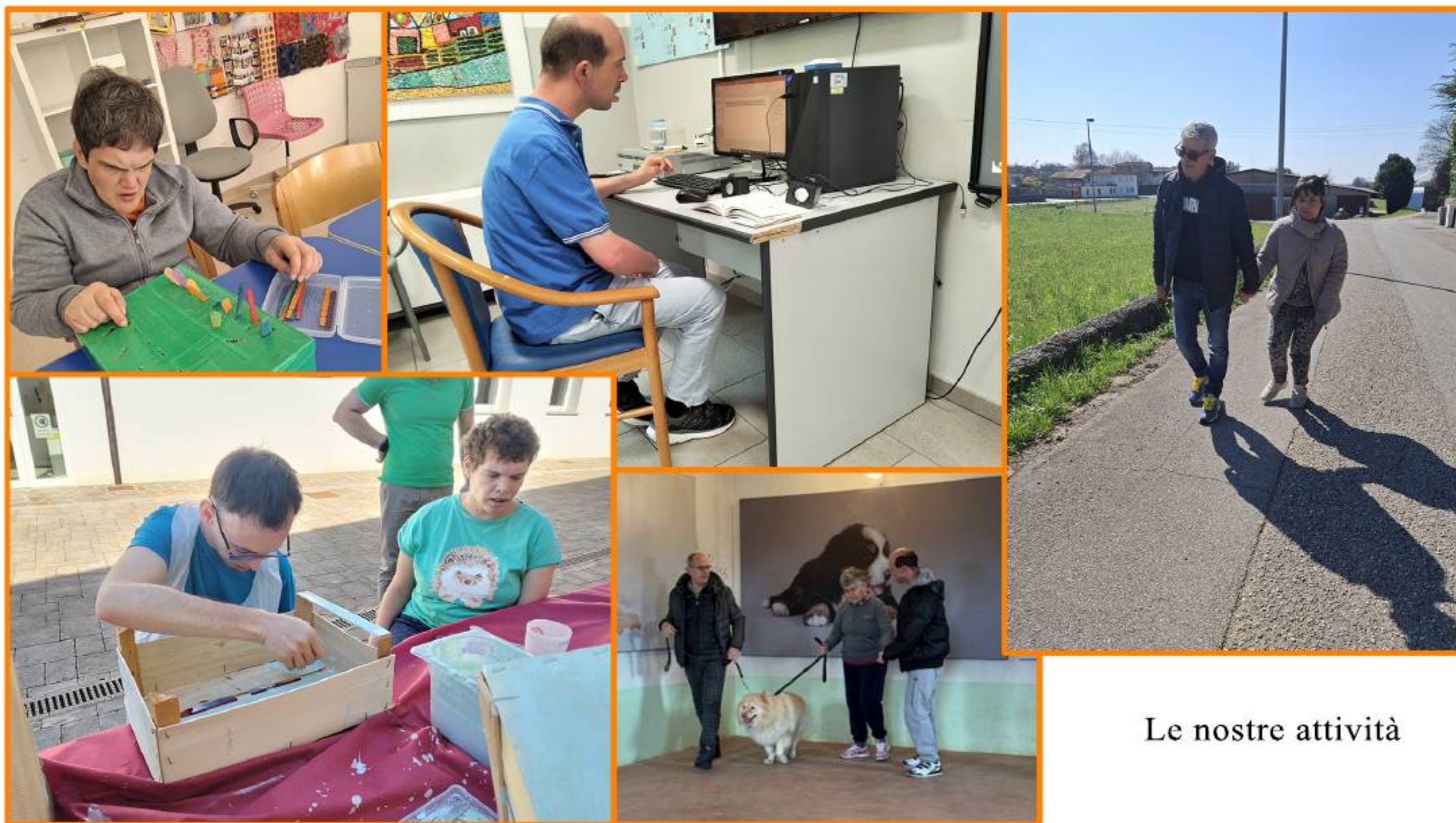
Le nostre attività