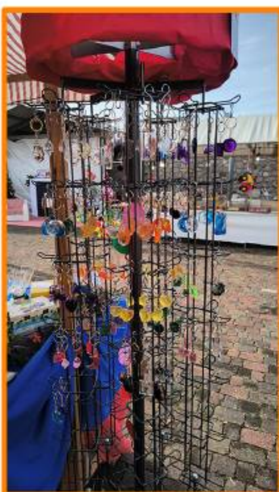
Mercatini a Ragogna, 6 dicembre 2025