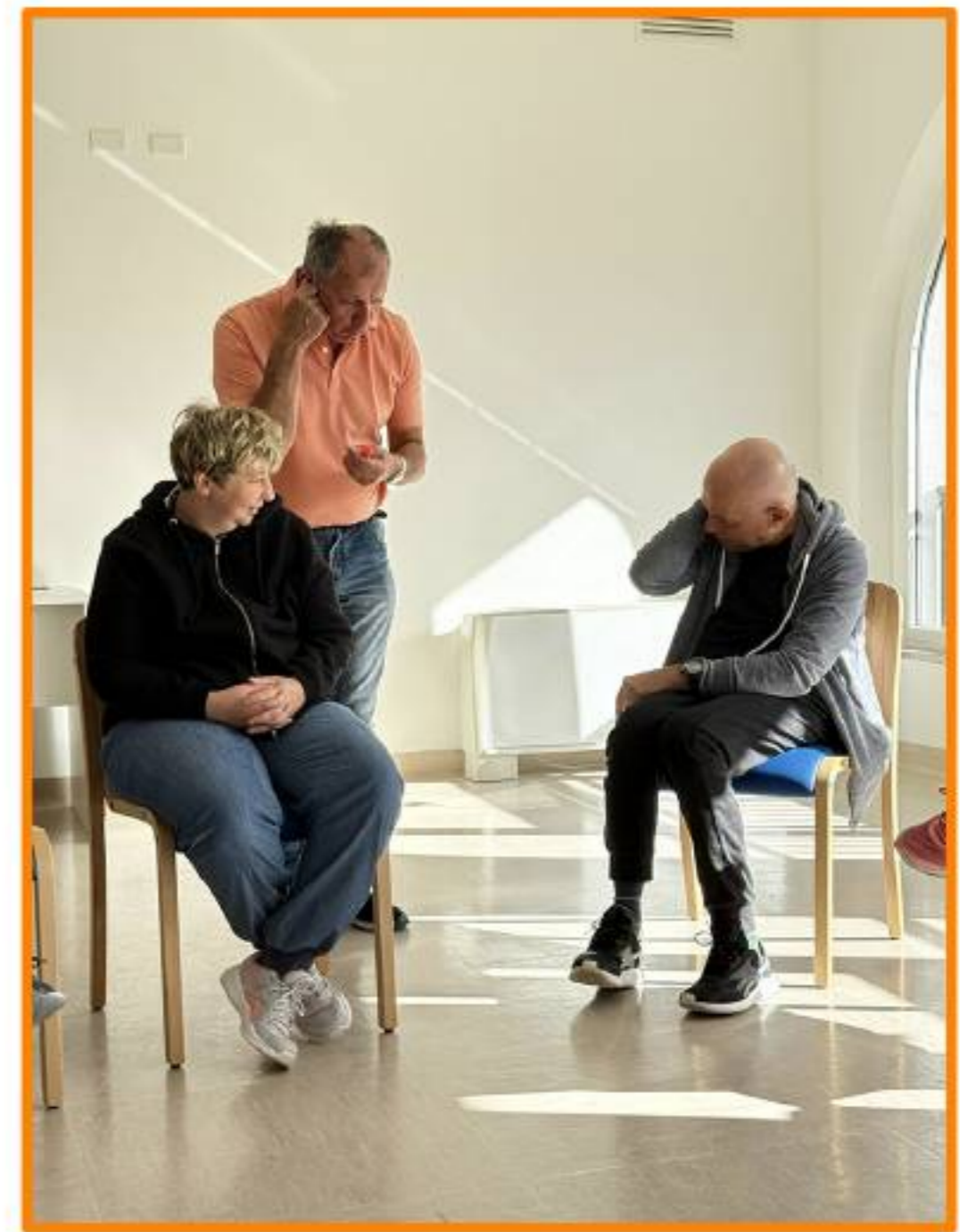
Le prove di teatro